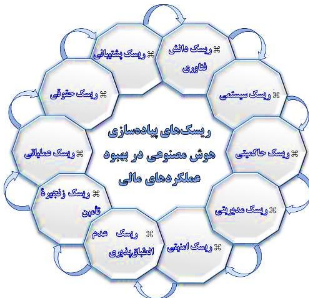
شکل ۲. چارچوب نظری پژوهش

در فاز کمی مطالعه حاضر که مبتنی بر رویکرد اثرات متقابل هریک از معیارهای اصلی بر روی یکدیگر می‌باشد، پژوهش با طرح سوال دوم پژوهش به دنبال دستیابی به یک نقشه راه استراتژیک در سطح شرکت پتروشیمی امیرکبیر می‌باشد.