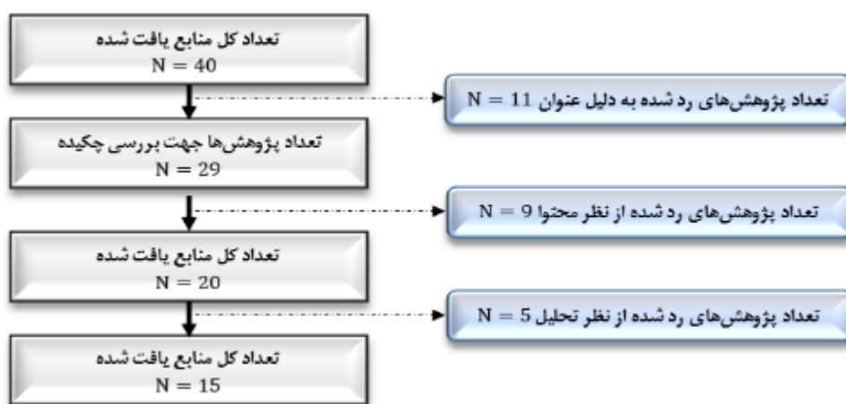
شکل ۱. تعیین پایه تعداد پژوهش‌های مورد بررسی

با تعیین پایگاه‌های اطلاعاتی در ادامه می‌بایست، نسبت به دسته‌بندی پژوهش‌های مرتبط در یک بازه زمانی بروز شده نسبت به پژوهش‌های دیگر اقدام نمود. چراکه در واقع هدف از رعایت چنین سازوکاری برای انتخاب، مبنایی برای بروز رسانی داده‌های مرتبط با پدیده مورد بررسی تلقی می‌شود. لذا برای این منظور، بازه زمانی ۵ سال اخیر یعنی سال‌های [۲۰۲۰] تا [۲۰۲۶] در پایگاه‌های بین المللی و [۱۴۰۰] تا [۱۴۰۴] در پایگاه‌های اطلاعات علمی داخلی مورد توجه قرار گرفته است. این کار به شناخت منسجم‌تری تحت شرایط حال حاضر دنیای مالی از نظر ریسک‌های توسعه هوش مصنوعی کمک می‌کند. لذا باهدف دستیابی به پژوهش‌های مرتبط با حوزه‌ی پژوهش در گام بعدی می‌بایست نسبت به غربالگری سه مرحله‌ای اولیه شامل غربالگری عنوان؛ محتوا و تحلیل اقدام شود. برای ایجاد ادراک مشخص‌تر، از شکل (۱) برای انجام گام دوم استفاده شده است.